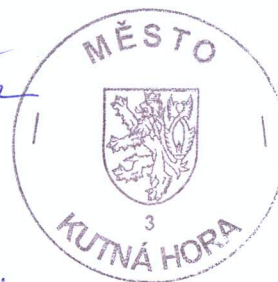
Ivo Šalátek starosta města

Podle ověřovací knihy p.č. 1103/03 podepsal tuto listinu před Městským úřadem v Kutné Hoře Jméno a příjmení: Ivo Šalátek RČ (mat) 57021610294 Trvale bytem: Kutná Hora, Nadrasová 304/15 č. op. (pazu) 100442 350 Dne: 29.9.2003 Správní poplatek zaplacen ve výši Kč :